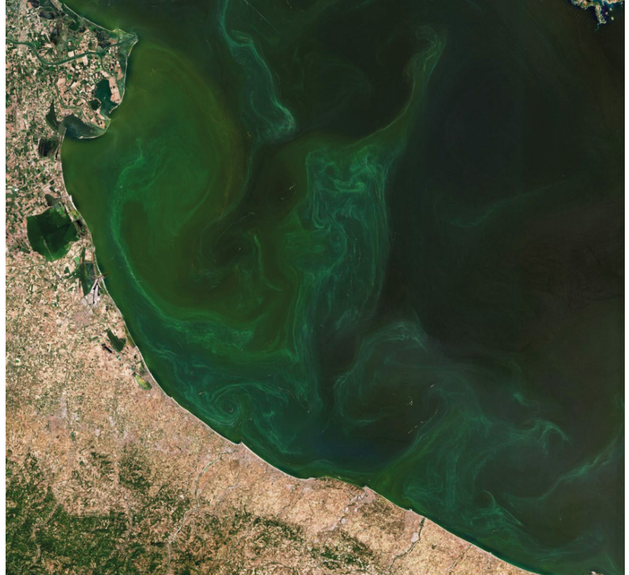
FIG. 3 ALGHE NEL MARE ADRIATICO SETTENTRIONALE Immagine di Copernicus Sentinel-2 che illustra i vortici di fioritura algale lungo la costa italiana.

CONTAINS MODIFIED COPERNICUS SENTINEL DATA (2024), PROCESSED BY ESA - ESA STANDARD LICENCE