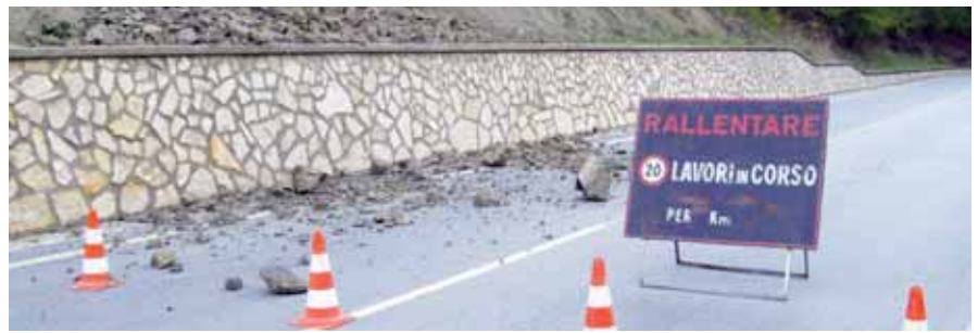
FIG. 1 PRECIPITAZIONI E FRANE

1. Arpa Emilia-Romagna 2. Ricercatrice Istituto di ricerca per la protezione idrogeologica, Consiglio nazionale delle ricerche (Cnr-Irpi), Torino